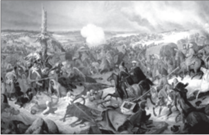
ერთ-ერთი ბრძოლის ეპიზოდი

სათის, რაც ხელს შეუშლიდა ლეკებს, საქართველოში შეჭრილიყვნენ. ამ ღონისძიებით შესაძლებლად მიაჩნდათ, მოეჭრათ პირდაპირი გზა ახალციხისაკენ და ეიძულებინათ ლეკები, შემოევლოთ ყარაგაჩიდან.