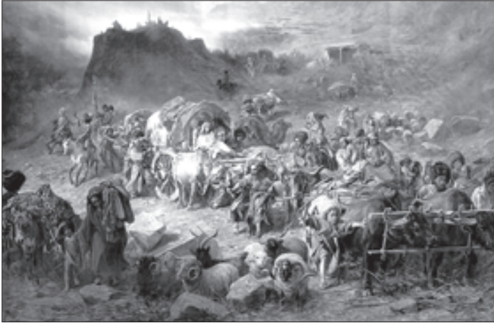
ვატრა ნიკოლოზის კი გრუზინსკი — „მთიელაზი აულს ტოვებან“

შჩედროვის პოლკი საქართველოში 1801 წელს ჩამოვიდა იმ 6 ათასი კაცის შემადგენლობით, რომლებიც პავლე I-ისა და გიორგი XII-ის მოლაპარაკებაში იყო მოხსენიებული. მათი საქართველოში ჩამოსვლა ზუსტად რომ სულზე მისწრება იყო და ქვეყანაში სტაბილურობის წინაპირობას წარმოადგენდა. ტურკოვის პოლკი, რომელსაც 2 ქვემეხი ჰქონდა, გორში, სურამსა და ცხინვალში განლაგდა. რუსების მიერ ამ ადგილების დაკავებამ აიძულა იმერეთის მეფე სოლომონი, გაეშვა თავისი ლაშქარი, რომელიც იმ ქორზე დაყრდნობით შეაგროვა, რომ რუსები საქართველოს ტოვებენო. გაქცეულ უფლისწულთა მიერ წაქეზებული მეფე ფიქრობდა ქართლში შეჭრას, მაგრამ უფლისწულთა განზრახვა განუხორციელებელი დარჩა. მათ იმედები თავიანთი გეგმების რეალიზაციის თაობაზე უფრო მე-