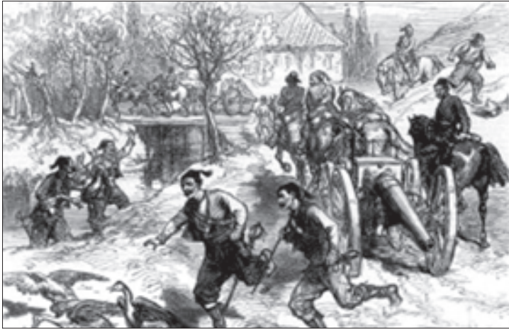
ოსმალოები კარცვავენ სოფელს

ზღვის ფლოტის ხმელთაშუა ზღვის ექსპედიციის პერიოდში).