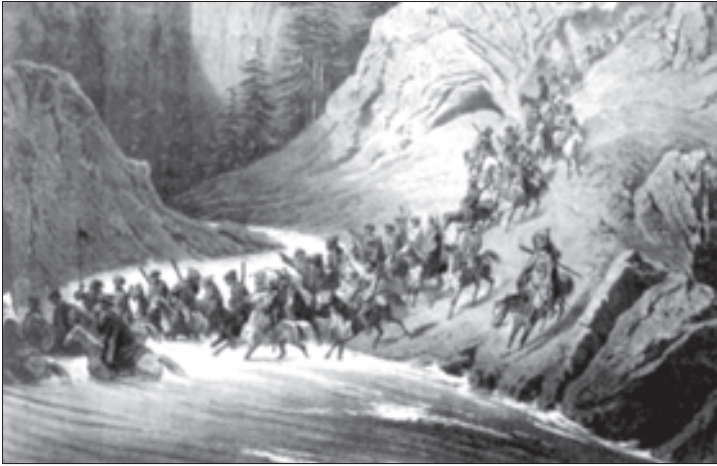
ღარბაჯის მიხედვით ჩერქეზები მთებიდან ეშვებოდნენ

რადღების ღირსი იყო მოვლენა, რომელმაც კარდინალურად შეცვალა სიტუაცია კავკასიის ხაზზე და საქართველოში. იმპერატორ ალექსანდრე პირველამდე მიდიოდა ხმები ამიერკავკასიის მხარისა და კავკასიის ხაზის მოუნესრიგებელი მმართველობის თაობაზე, არადა, მთავარი ახლა იყო საქართველო. კოვალენსკის უტაქტობამ და ანგარებიანობამ საბოლოოდ განარისხა ქართველები, რომლებმაც კვლავ უფლისწულებს დაუჭირეს მხარი. უკეთესად არც კ. ფ. კნორინგი იქცეოდა. ამიტომ 1802 წლის 8 სექტემბერს მეფის ბრძანებით კნორინგიცა და კოვალენსკიც უკან გაითხოვეს, ხოლო მთავარსარდლად საქართველოში გენერალ-ლეიტენანტი პავლე დიმიტრის ძე ციციანოვი დაინიშნა. მან მთლიანად შეცვალა მთიელებთან ბრძოლის ტაქტიკა. თუ კნო-