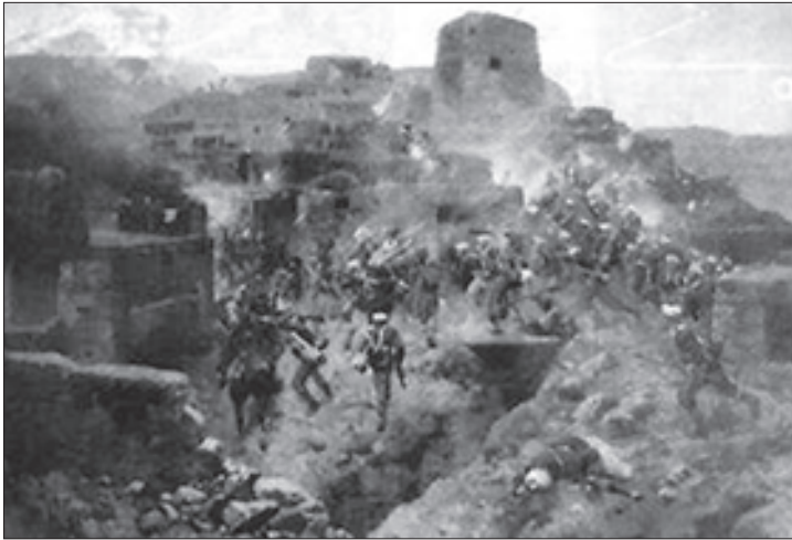
რუსი ჯარისკაცების შეტაკება ჩრდილოკავკასიელ მოთარეშებებთან

ქართულ მიწა-წყალზე ჩამოსახლებული ჩრდილოკავკასიელების მიერ შექმნილი პუნქტები საიმედო დასაყრდენი გახდა დალესტნის სოცია-